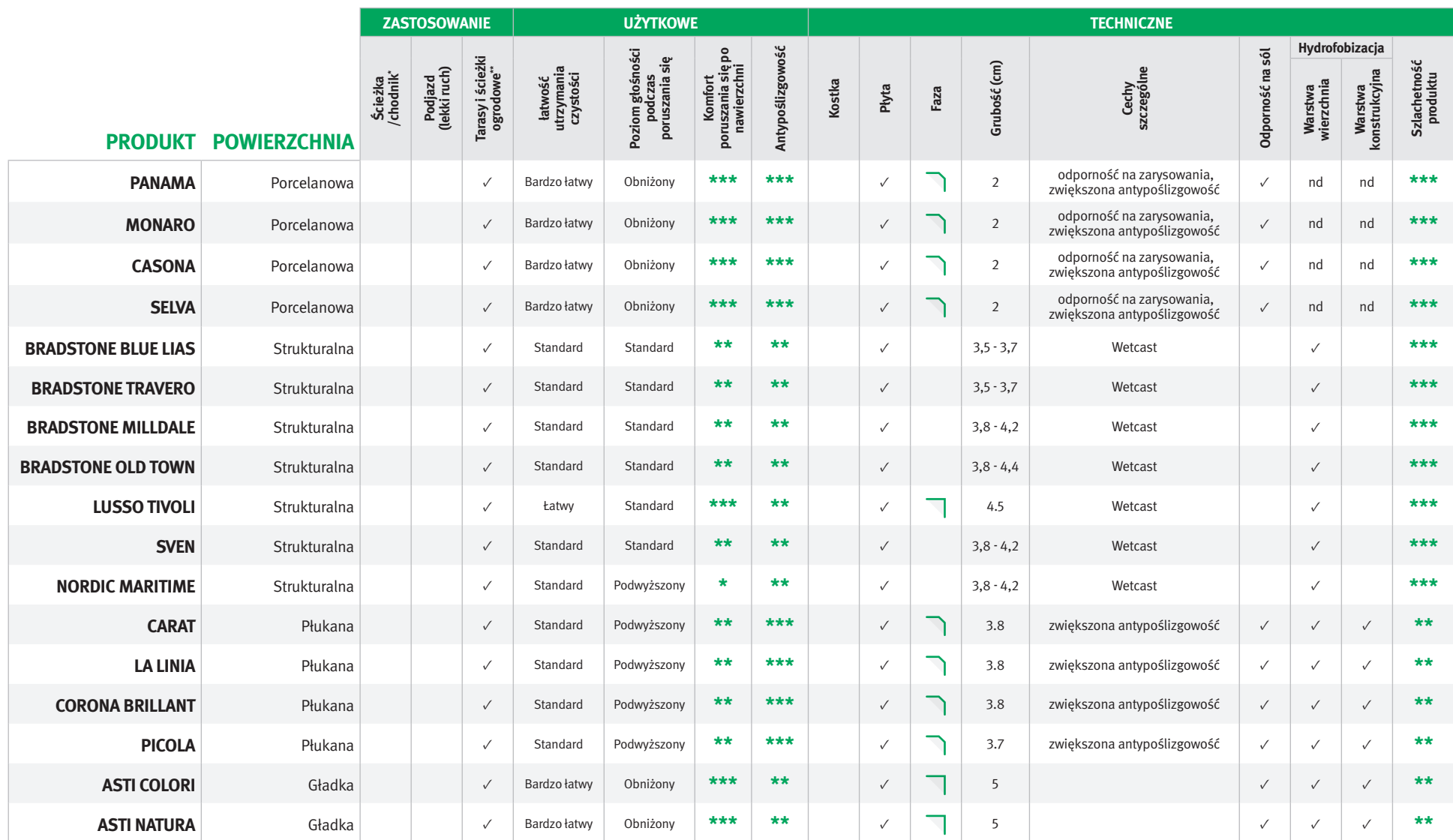
TABELA CECH UŻYTKOWYCH - TARASY

Informacje porównawcze dla wybranych produktów mające charakter poglądowy.